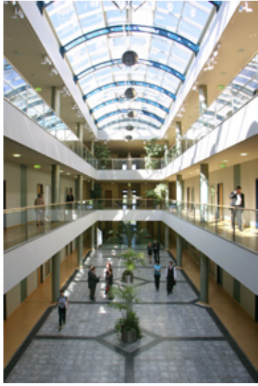
莱比锡欧亚经贸中心的中央大厅

十多年来，莱比锡博信欧亚经贸中心一直以莱比锡博览会有限责任公司的独立子公司在市场运营。多语种的工作团队以专有的技术知识和广泛地商际网络为国内外企业成功地进驻莱比锡提供服务。