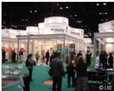
莱比锡国际博览会有限公司 (LMI) 在海外展会上筹办德国企业共同展台, 正如2010年芝加哥国际生物科技展, 共组织了40家德国参展商。