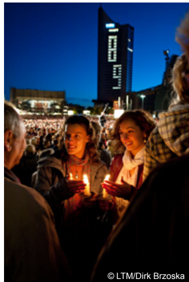
莱比锡市中心2009年灯光节的情景

www.amistyle-leipzig.de www.leipziger-messe.de