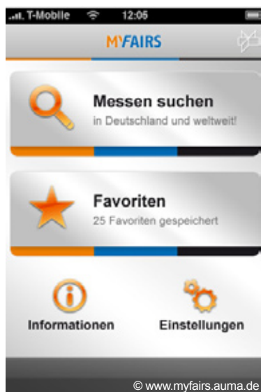
«MyFairs» – приложение для мобильного доступа к данным по выставкам по всему миру

Представительства Лейпцигской ярмарки за рубежом, программа выставок