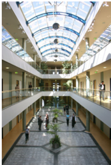
Атриум в здании компании «MaxicoM Евро-Азия Бизнес Центр Лейпциг»

Свыше десяти лет компания «MaxicoM ГмбХ Евро-Азия Бизнес Центр Лейпциг» работает на рынке в качестве самостоятельного дочернего предприятия компании «Лейпцигская ярмарка ГмбХ». Предлагая специальное ноу-хау и сеть контактов, многоязычная команда компании делает все для того, чтобы открытие новых германских и иностранных компаний в Лейпциге было успешным.